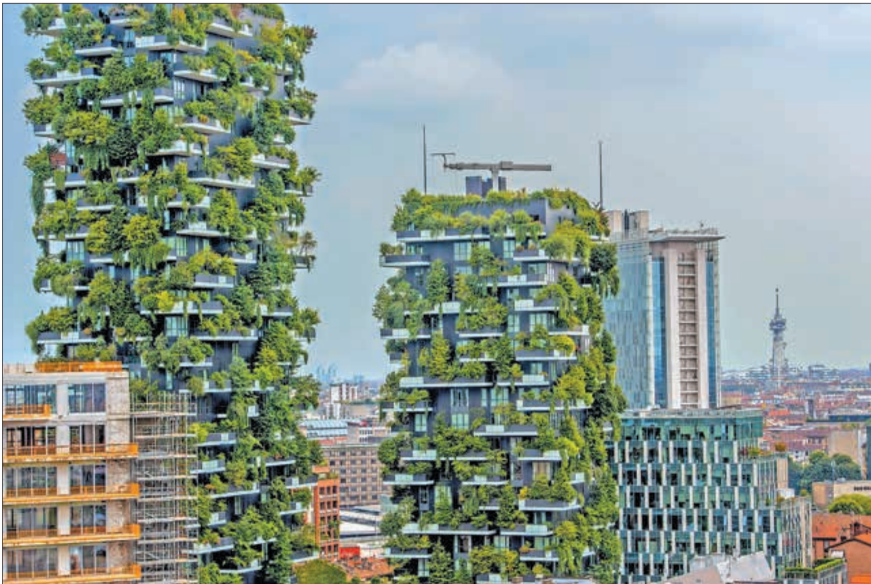
«Зеленые» технологии в строительстве — это не только «вертикальные» сады, но и в первую очередь система очистки города от мусора, накопленного десятилетиями активного девелопмента.

ГОРОДА СКОРО БУДУТ ГЕНЕРИРОВАТЬ ПОЛОВИНУ ВЫБРОСОВ ПАРНИКОВЫХ ГАЗОВ