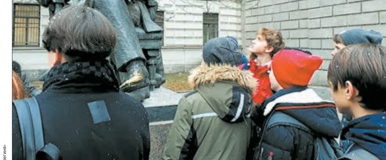
С главным «метрологическим» учреждением страны, ВНИИМ им. Д. И. Менделеева, школьники познакомились 8 февраля, в День науки.

Системы измерений можно объяснять и на таких вот разгуженных линейках, и на часах или картах, загруженных в смартфоны.