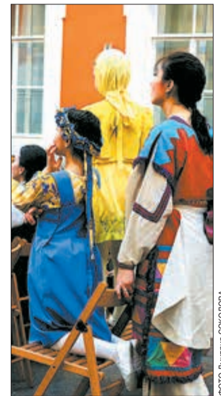
Юные артистки в ожидании своего выхода.