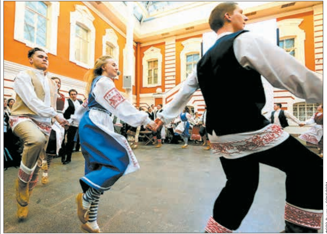
В репертуаре ансамбля народной музыки Toive Петрозаводского госуниверситета — карельские и вепские песни и танцы, собранные в поездках по деревням и поселкам Карелии.

И при этом — более мягкими по отношению к приезжим. Документ относит некую «административную амнистию» нарушителям: «Институт запрета на въезд в РФ должен применяться более избирательно, прежде всего в отношении лиц, пребывание которых реально угрожает охраняемым законом интересам... Важно предусмотреть положения, предоставляющие возможность иностранным гражданам, нарушившим миграционное законодательство, но не представляющим серьезной опасности для России, не выезжая из РФ, оформить легальный статус без привлечения к ответственности».