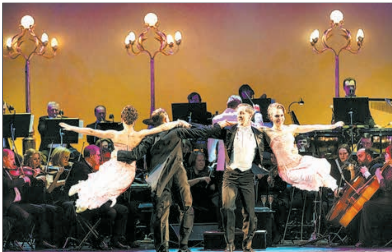
ФОТО МАРИИ КОВАЛЕВОЙ/Иллюстрация пресс-службой Театра музыкальной комедии

Сценарий в «Легар-гала» был нацелен, скорее, на гладкость швов между номерами, без особых драматур-