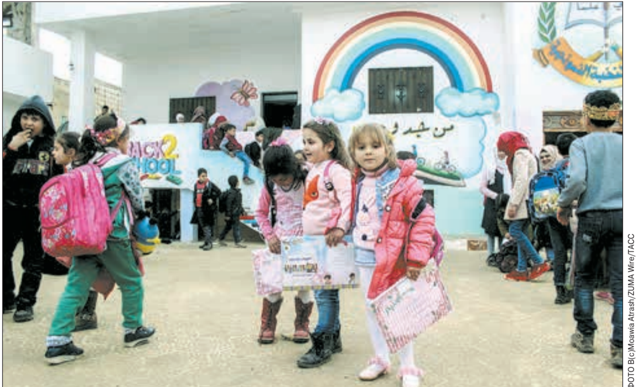
СИРИЯ. Школы в сельских районах провинции Идлиб вернулись к нормальной работе.