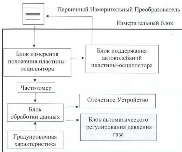
Рисунок 2 – Структурная схема эталонного вакуумметра

Был разработан состав эталонного вакуумметра, соответствующий требованиям ГОСТ «Средства измерений давления» в виде структурной схемы, изображенной на рисунке 2.