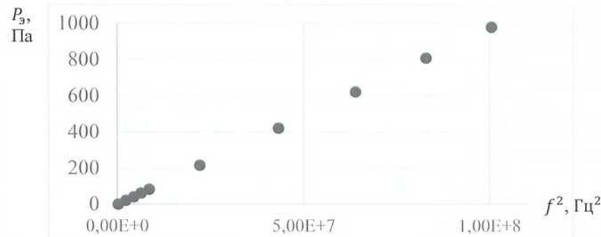
Рисунок 4 – Представление градуировочной характеристики в графическом виде

Градуировочная характеристика показана в виде графика на рисунке 4.